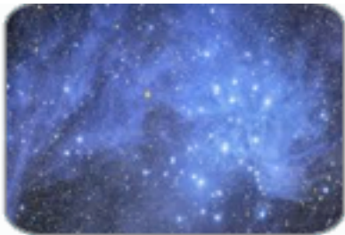
กระจุกดาวเปิด (ลูกไก่)