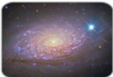
กาแล็คซี่ (ดอกทานตะวัน)