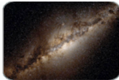
กาแล็คซี่ (ทางช้างเผือก)