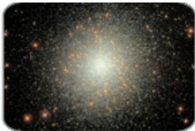
กระจุกดาวทรงกลม (เฮอร์คิวลิส)