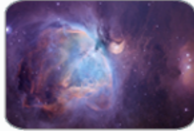
เนบิวล่า (นายพราน)