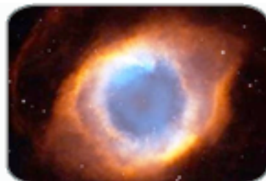
เนบิวล่าคล้ายดาวเคราะห์ (เฮลิคส์)