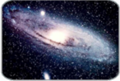
กาแล็คซี่ (แอนดรอเมตา)